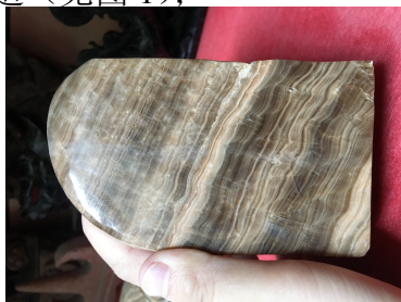
图 1 峻山的条带构造