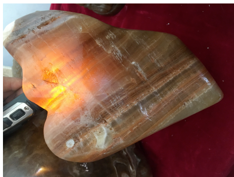
图 2 红棕色、呈半透明状的峻山玉

(3) 光性：主要矿物方解石为一轴晶，负光性；矿物集合体为非均质集合体； (4) 折射率：对样品进行检测，折射率变化较大，折射率约在 1.486-1.658 之间，数据变化较大，应与较大的双折率有关，该现象与测试方解石现象保持一致；