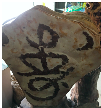
图4 寿字崮山玉产品

颜色分布，进行多层不同程度加工以形成独特又具有文化特色的产品，下图的崮山玉就是摒弃了传统的雕刻工艺，利用崮山玉的颜色分层采用平面加工，使观赏石上的“寿”字看起来像自然生长出来，增强其美感（图4）。还可是根据崮山玉常见棕色的复古庄重颜色，将其制作成体现传统文化色彩的产品或与其他宝石材料进行结合形成多元素珠宝产品。