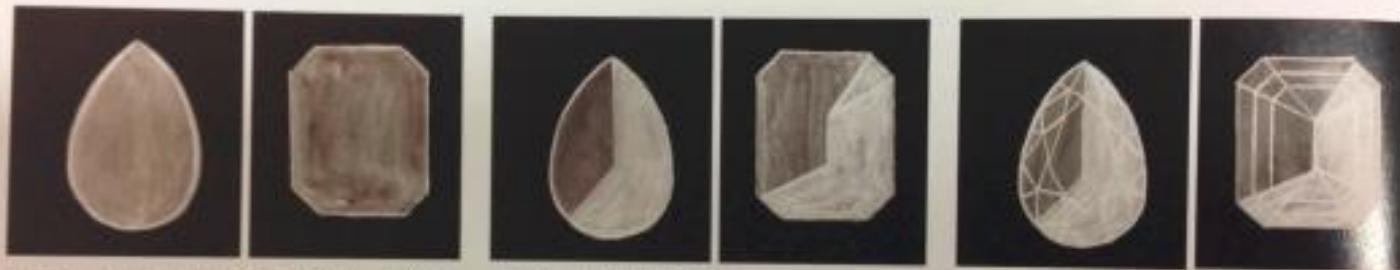
步骤 1：在黑卡上画出钻石的外形，平涂暗部色彩，留出白边