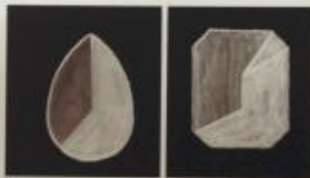
步骤 2：区分暗部和亮部