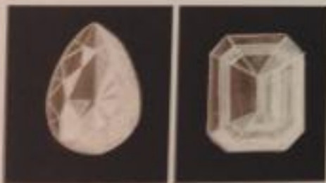
步骤 4：细化各个刻面的反光情况