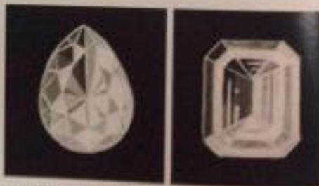
步骤 6：加深最亮几个刻面的色彩，突出明暗对比关系，修整各个刻面的色彩和线条等