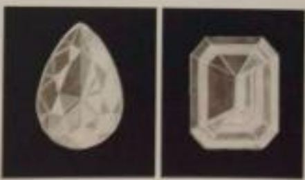
步骤 5：继续细化各个刻面的反光情况